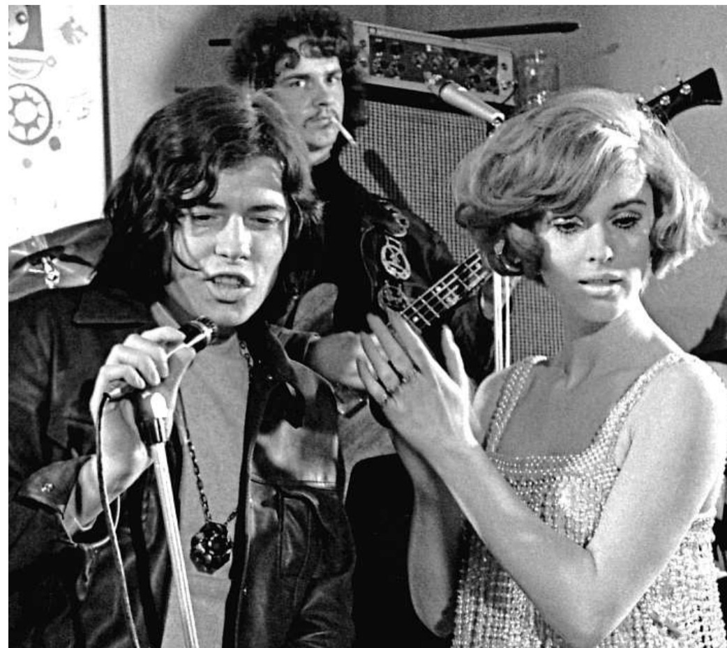
Éra Slunečního hrobu. Vladimír Mišík na snímku z roku 1969, když zpíval v kapele Blue Effect.

Na Mišíkovy písně, hrávané v hospodách, vlacích i u trampských ohniček, jsme si zvykli. Skladby jako Variace na renesanční téma („Večernice“) nebo Proč ta růže uvadlá se dočkaly